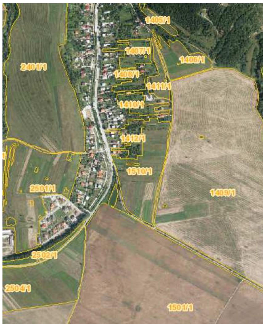
Obr. č. 6: Register poľnohospodársky využívaných pozemkov v záujmovom území